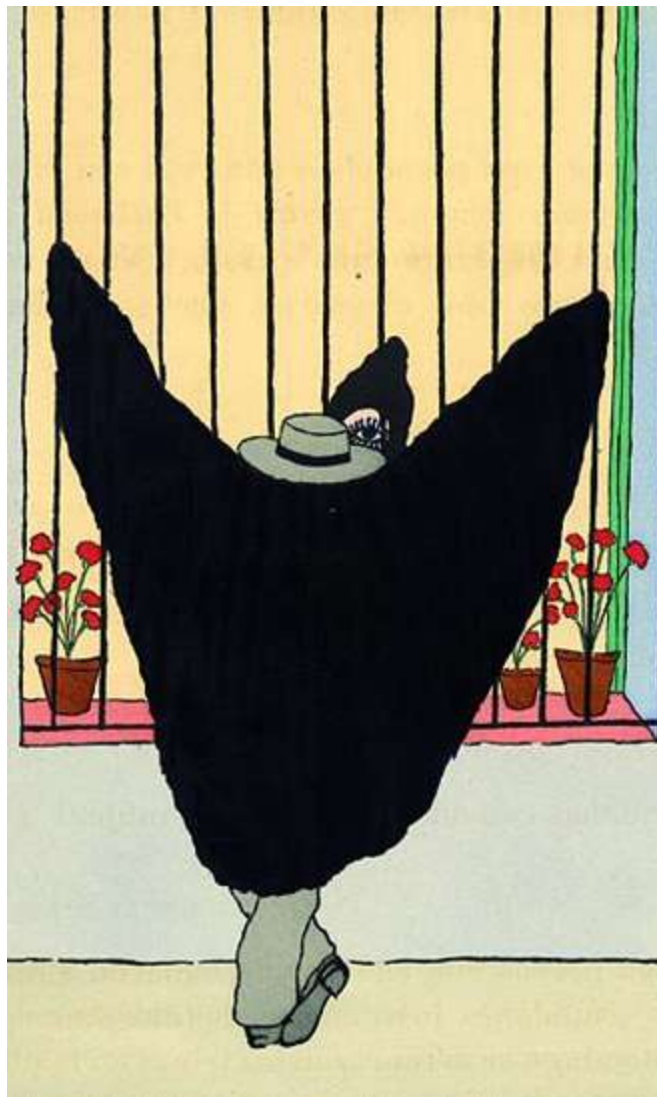
Murciélago sevillano pelando la pava por Oliverio Girondo, 1921