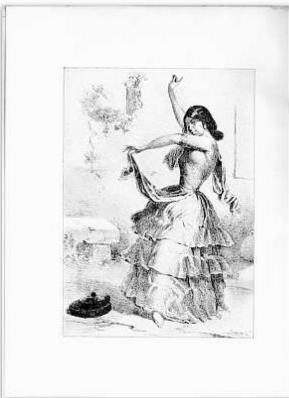
Grabado de La Cujíñi

tes ingleses de caballos: «If a woman, rich or poor, a Countess from Madrid, or maiden of the Caloró from the Triana, chanced to pass, they criticized her as a prospective does a horse at Tattersall's. Her eyes, her feet, her air, everything