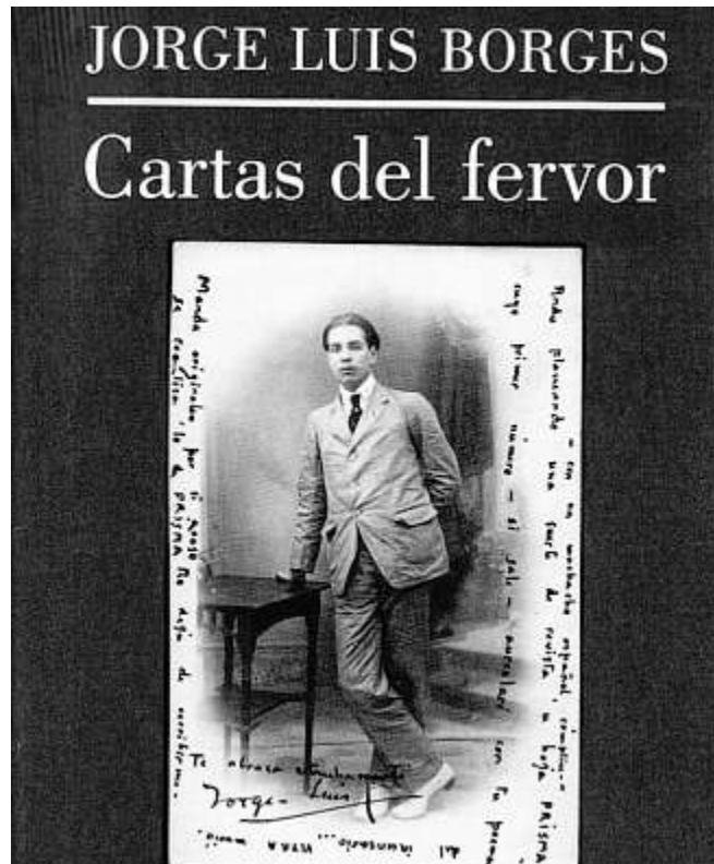
Cubierta de "Cartas del fervor" (1999)